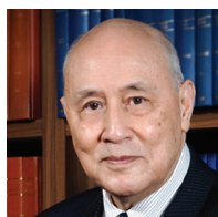
梁定邦 SC JP 亚洲国际法律研究院 主席

梁定邦博士为香港资深大律师，从事国际诉讼、仲裁和金融监管的法律事务。他在香港公务员行列服务了十三年后，于1979年开始在香港执业。1991年至1994年，梁博士曾担任香港联合交易所（联交所）理事会及上市委员会委员，并身兼其纪律委员会及债务证券工作小组主席，以及担任联交所香港及中国上市小组法律委员会的联席主席，负责制定中国企业于香港上市的法律框架。1995年至1998年，出任香港证券及期货事务监察委员会主席。同时，是首位获选为国际证监会组织技术委员会主席的亚裔人士。1999年至2004年，应中国国务院前总理朱镕基的私人邀请，出任中国证监会首席顾问。2018年6月至2021年5月，获委任为独立监察警方处理投诉委员会主席。他曾任香港金融管理局（金管局）金融学院专家小组召集人，现担任金管局金融学院筹备委员会成员。2018年他获委任为二十国集团工商峰会金融促增长及基础设施专责小组联席主席，另获委任为中国证券化论坛的联席主席。