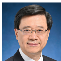
李家超 GBM SBS PDSM PMSM 中华人民共和国香港特别行政区 行政长官

黄进教授现任中国人权发展基金会理事会副理事长、最高人民法院特邀咨询员以及最高人民检察院专家咨询员。历任国际体育仲裁院、国际投资争端解决中心、巴黎国际仲裁院、中国国际经济贸易仲裁委员会以及韩国商事仲裁院的仲裁员。