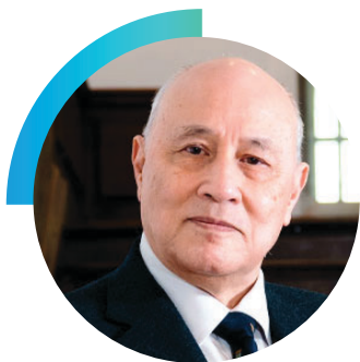
梁定邦 资深大律师、太平绅士 亚洲国际法律研究院 主席

梁定邦博士为香港资深大律师，从事国际诉讼、仲裁和金融监管的法律事务。他在香港公务员行列服务了13年后，于1979年开始在香港执业。1991年至1994年，梁博士曾担任香港联合交易所（联交所）理事会及上市委员会委员，并身兼其纪律委员会及债务证券工作小组主席，以及担任联交所香港及中国上市小组法律委员会的联席主席，负责制定中国企业于香港上市的法律框架。1995年1998年，出任香港证券及期货事务监察委员会主席。同时，是首位获选为国际证监会组织技术委员会主席的亚裔人士。1999年2004年，应中国国务院前总理朱镕基的私人邀请，出任中国证监会首席顾问。2018年6月至2021年5月，获委任为独立监察警方处理投诉委员会主席。他曾任香港金融管理局（金管局）金融学院专家小组召集人，并担任金管局金融学院筹备委员会成员。2018年他获委任为二十国集团工商峰会金融促增长及基础设施专责小组联席主席，另获委任为中国证券化论坛的联席主席。