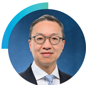
林定国 金紫荆星章、资深大律师、太平绅士 中华人民共和国香港特别行政区政府 律政司司长

梁定邦博士为香港资深大律师，从事国际诉讼、仲裁和金融监管的法律事务。他在香港公务员行列服务了13年后，于1979年开始在香港执业。1991年至1994年，梁博士曾担任香港联合交易所（联交所）理事会及上市委员会委员，并身兼其纪律委员会及债务证券工作小组主席，以及担任联交所香港及中国上市小组法律委员会的联席主席，负责制定中国企业于香港上市的法律框架。1995年1998年，出任香港证券及期货事务监察委员会主席。同时，是首位获选为国际证监会组织技术委员会主席的亚裔人士。1999年2004年，应中国国务院前总理朱镕基的私人邀请，出任中国证监会首席顾问。2018年6月至2021年5月，获委任为独立监察警方处理投诉委员会主席。他曾任香港金融管理局（金管局）金融学院专家小组召集人，并担任金管局金融学院筹备委员会成员。2018年他获委任为二十国集团工商峰会金融促增长及基础设施专责小组联席主席，另获委任为中国证券化论坛的联席主席。