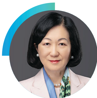
叶刘淑仪 大紫荆勋贤、金紫荆星章、太平绅士 中华人民共和国香港特别行政区政府 行政会议非官守议员召集人