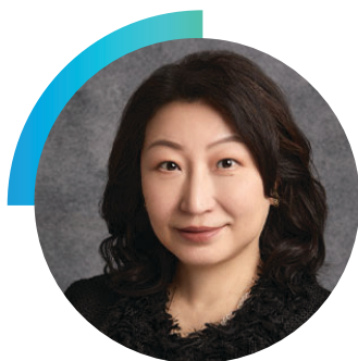
郑若骅 大紫荆勋贤、金紫荆星章、资深大律师、太平绅士 国际调解院 秘书长

郑若骅教授是国际调解院首任秘书长。她曾于2018年1月至2022年6月担任中国香港特区律政司司长。郑教授曾担任国际商会国际仲裁院和国际商事仲裁理事会副主席。2008年，她当选特许仲裁员协会全球主席，成为首位担任该职位的亚洲女性。她曾任世界银行制裁委员会委员，以及2021年召开的亚洲—非洲法律协商组织第59届年会主席。郑教授拥有丰富的争议解决经验，曾以大律师、仲裁员和调解员身份参与多起复杂的国际商事及投资案件。2011年，她获国际投资争端解决中心行政理事会主席委任，进入国际投资争端解决中心仲裁员名册，2017年获中国委任进入名册。她曾担任国际投资争端解决中心和常设仲裁法院管理的投资者—东道国争端仲裁员，以及国际投资争端解决中心撤销程序中的临时委员会委员。在学术领域，她现在担任清华大学兼职教授。